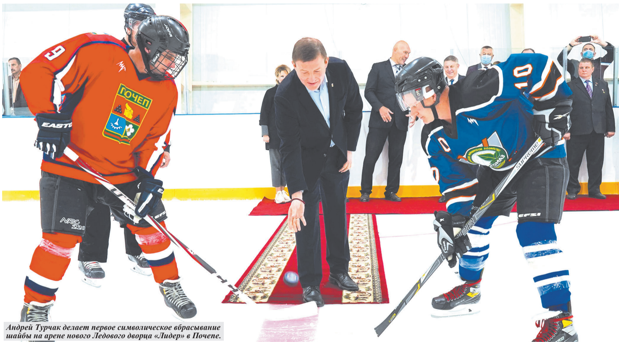
Андрей Турчак делает первое символическое вбрасывание шайбы на арене нового Ледового дворца «Лидер» в Почепе.

Брянскую область с рабочим визитом посетил первый заместитель председателя Совета Федерации ФС РФ Андрей Турчак